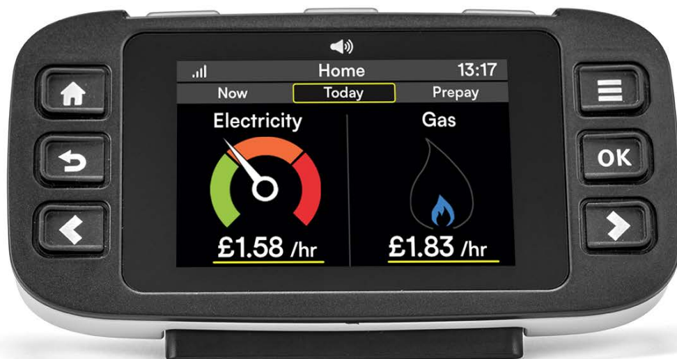
ਪਹੁੰਚਯੋਗ ਇਨ-ਹੋਮ ਡਿਸਪਲੇ ਅਤੇ ਚਿੱਤਰ ਸਿਰਫ ਉਦਾਹਰਨ ਲਈ ਹਨ

ਆਪਣੇ ਸਪਲਾਇਰ ਨੂੰ ਇੱਕ ਪਹੁੰਚਯੋਗ ਇਨ-ਹੋਮ ਡਿਸਪਲੇ ਪਾਉਣ ਲਈ ਵਧੇਰੀ ਜਾਣਕਾਰੀ ਪਾਉਣ ਬਾਰੇ ਪੁੱਛੋ।